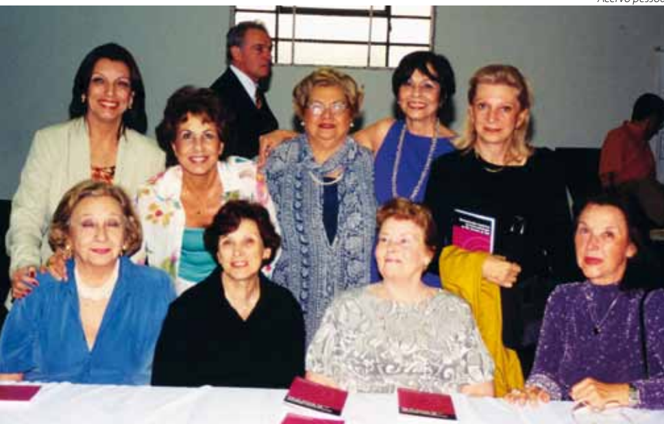
Foto histórica das pioneiras da Fonoaudiologia no Rio Grande do Sul.