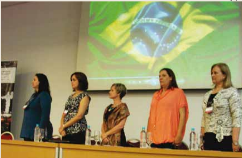
Solenidade de Abertura do IV Congresso Sul Brasileiro de Fonoaudiologia, em setembro de 2011.