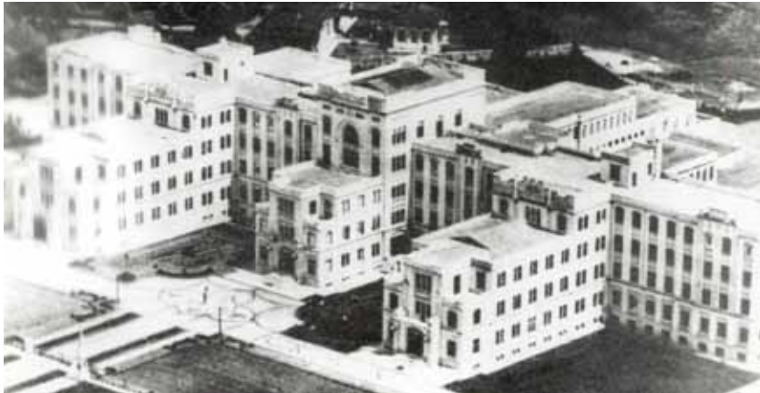
Faculdade de Medicina da USP, local que acolheu o curso de Fonoaudiologia, em 1960.