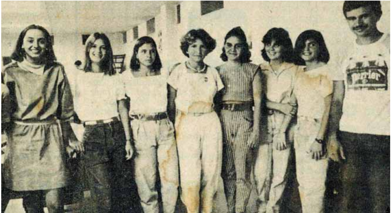
Primeira turma de Fonoaudiologia do Ceará durante o curso.