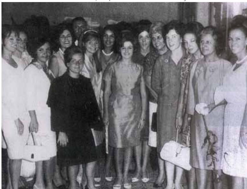
Alunas de um dos cursos de Terapia da Palavra existentes em 1964.