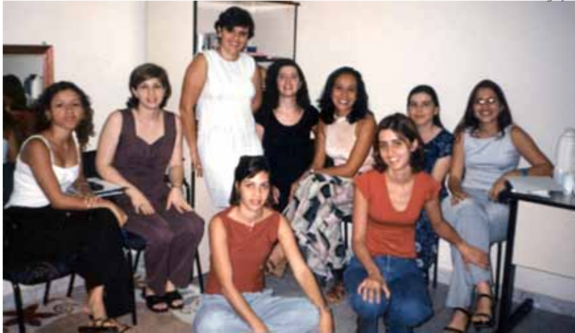
Reunião da primeira diretoria da Afeto, em 1999.