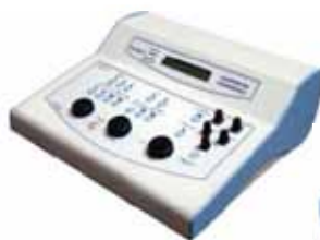
Audiômetro AO-250D de fabricação própria com Registro na ANVISA nº 80100810004