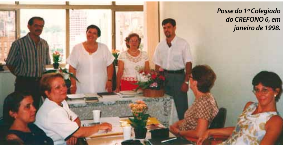
Posse do 1º Colegiado do CREFONO 6, em janeiro de 1998.